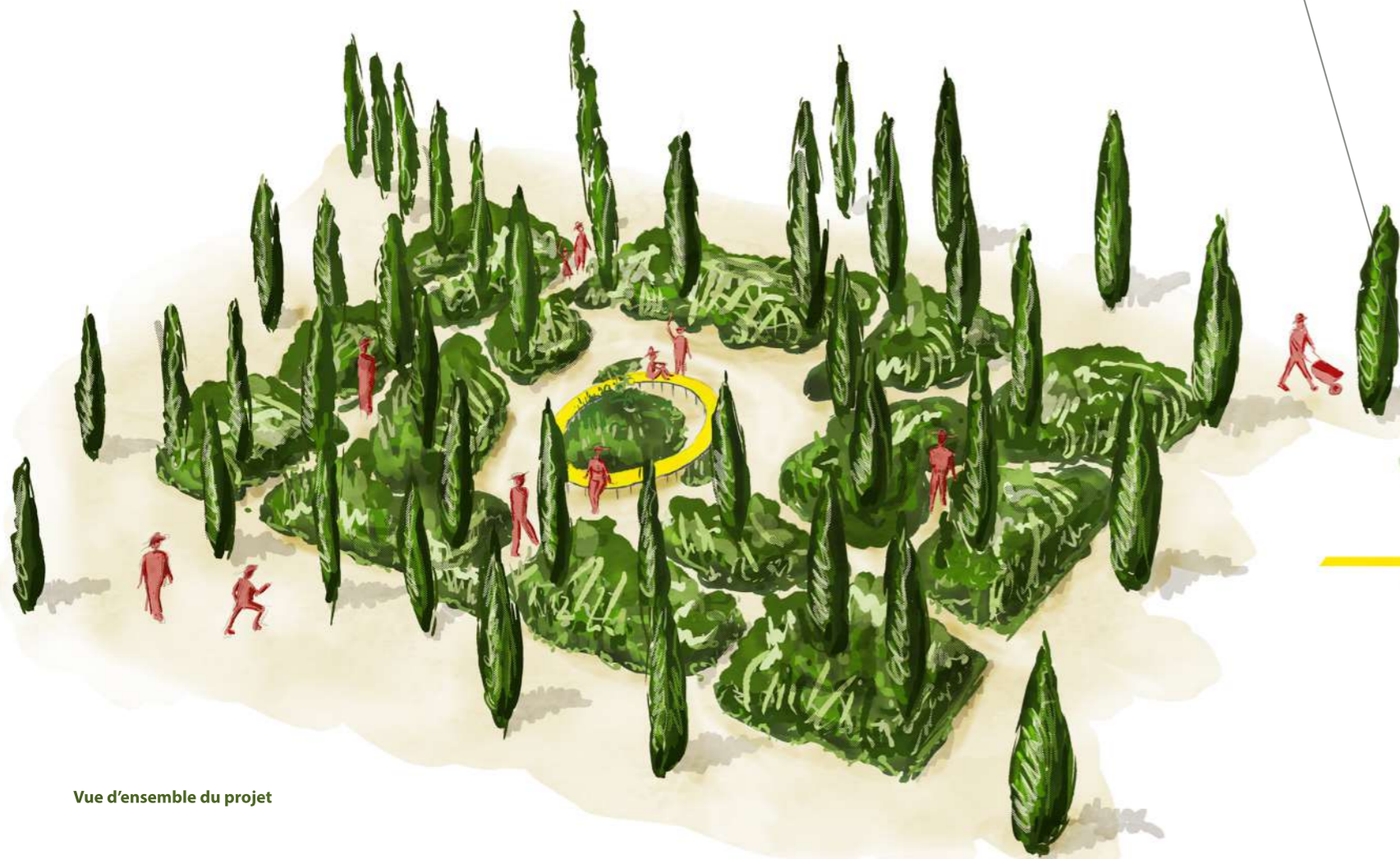
Vue d'ensemble du projet