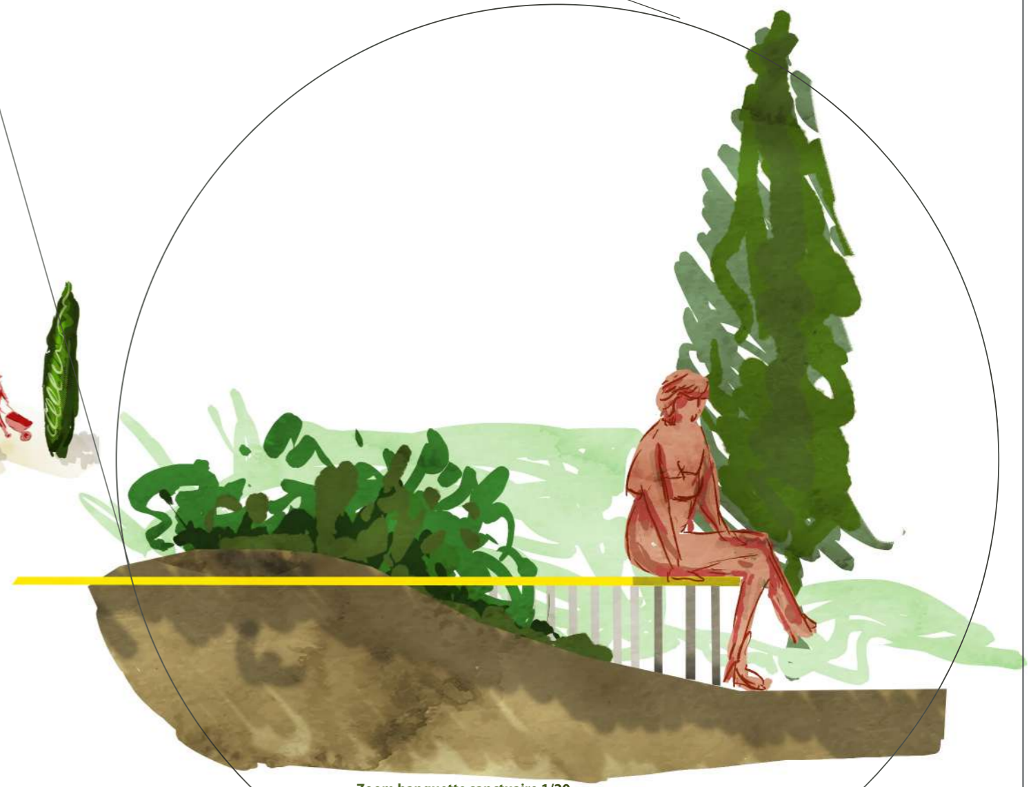
Zoom banquette sanctuaire 1/20 Bois 5cm couleur jaune primaire Structure métal et pieds tubulaires métal noir Fondation sur dalle en sous sol