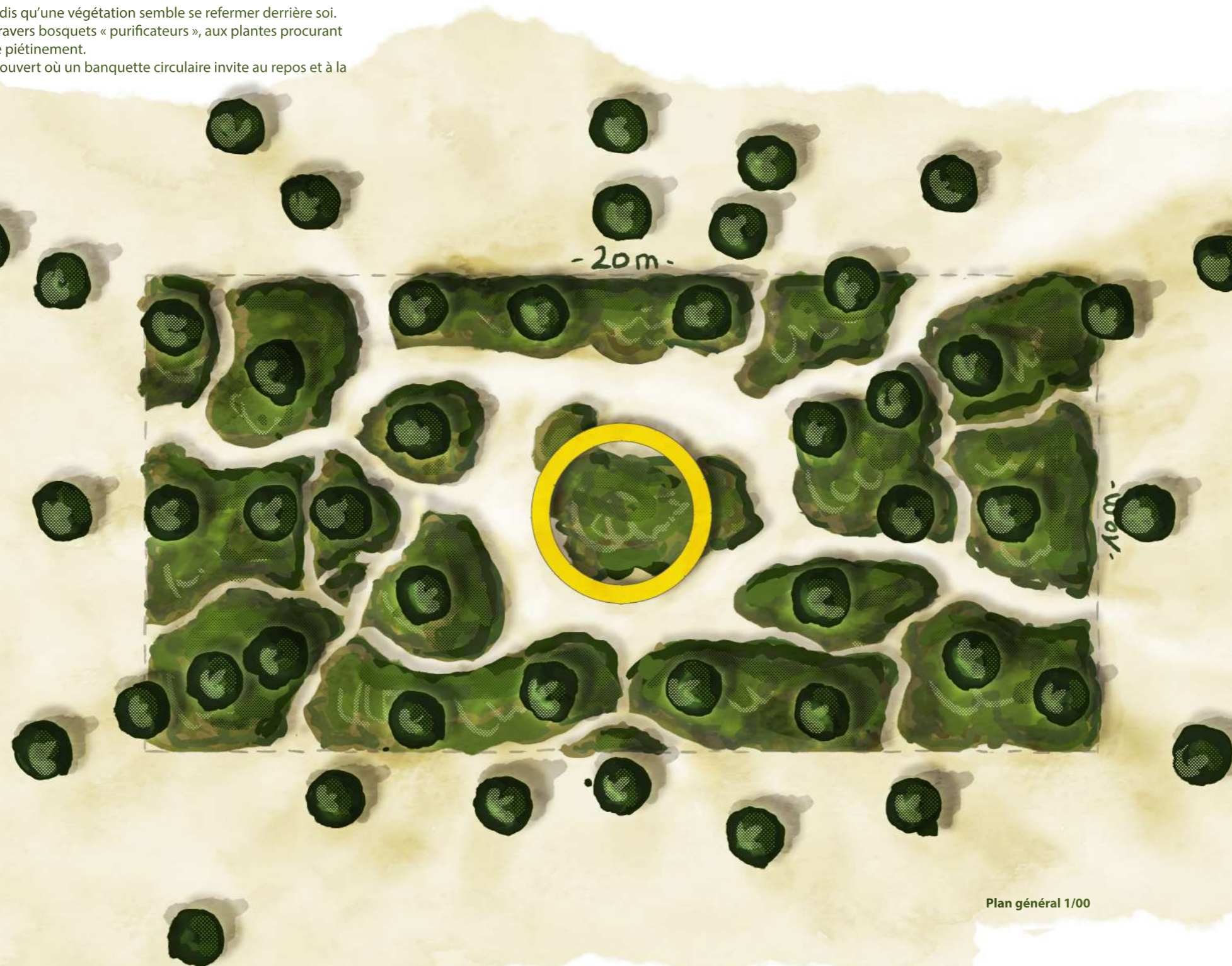
Plan général 1/00

- Pinus mugo - Rosa 'Gertrude Jekyll' - Azalea mollis jaune - Dryopteris filix-mas - Cornouiller stolonifère 'Flaviramea' - Agastache foeniculum - Verbena officinalis - Mentha suaveolens - Thymus vulgaris - Salvia rosmarinus - Hemerocalis 'On and On' - Carex flacca 'Buis'