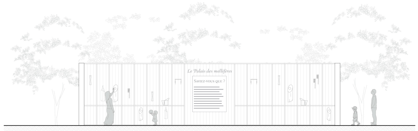
Élévation du mur des outils de l'apiculteur - 1:100