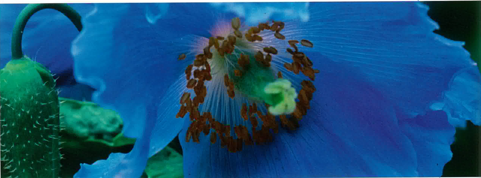
Pavot bleu de l'Himalaya, emblème des jardins de Métis ( Meconopsis betonicifolia ).

L'enthousiasme des jardins a entraîné la multiplication des manifestations. Les villes fleuries, les floralies, les foires aux plantes se propagent durant la saison où l'on peut admirer la diversité des végétaux. On ne sait plus où donner de la tête : les nouveautés germent de partout, aussi attractives les unes que les autres ! Mais, le plus marquant, c'est l'épanouissement des jardins éphémères. Un des premiers d'entre eux fut le festival de Chaumont. L'image créatrice de Jean-Paul Pigeat, son fondateur, donne une poussée de sève à d'autres festivals en France comme à l'étranger. Interprétés comme des parcours dans la ville pour certains ou s'épanouissant dans un parc aménagé, ils renouvellent la vision de l'espace urbain et permettent un éveil visuel et auditif sur le végétal, les minéraux et des matériaux inattendus, et une approche artistique. Les thèmes, renouvelés chaque année, ne cessent d'interpeller le visiteur, de le faire réagir et réfléchir. Ils bousculent plantes et hommes. D'ambiance en ambiance, de surprise en surprise, ils nous amènent par leurs expositions spectaculaires ou provocatrices à des idées qui font leur chemin dans notre environnement. Ce mélange de botanique, de perception de concepts, de poésie nous montre que le jardin n'est pas figé dans sa réalisation mais en éternelle évolution. Plus encore, il permet aux organisateurs de croiser leurs savoirs et de développer un vivier de paysagistes connus ou de lancer des jeunes en pointe de l'être !