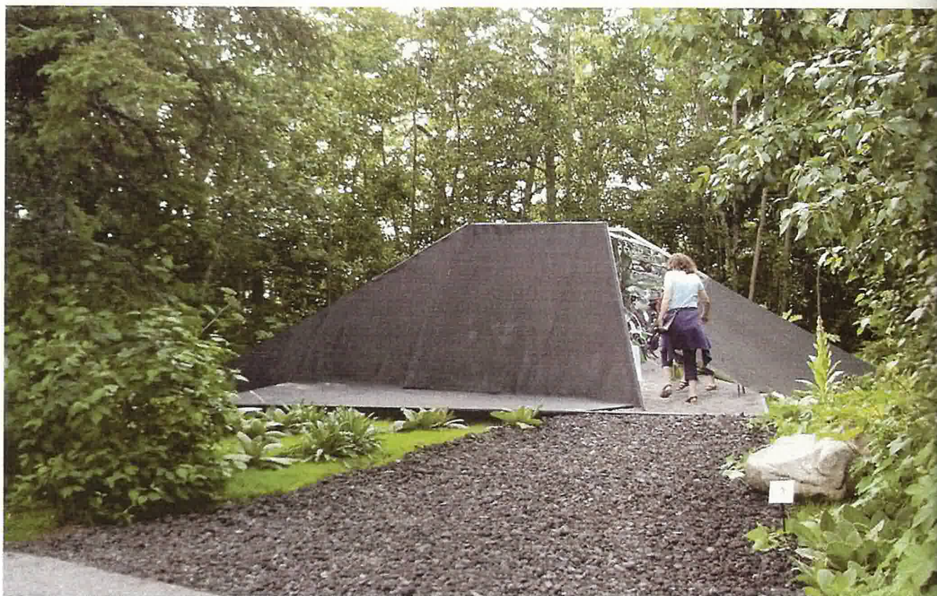
LA UTILIZACIÓN de tubos de riego para transmitir sonidos, es la principal característica de este jardín que se encuentra encerrado en una caja negra