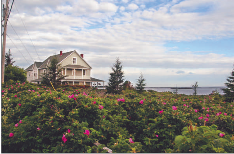
Maison typique à Métis-sur-Mer