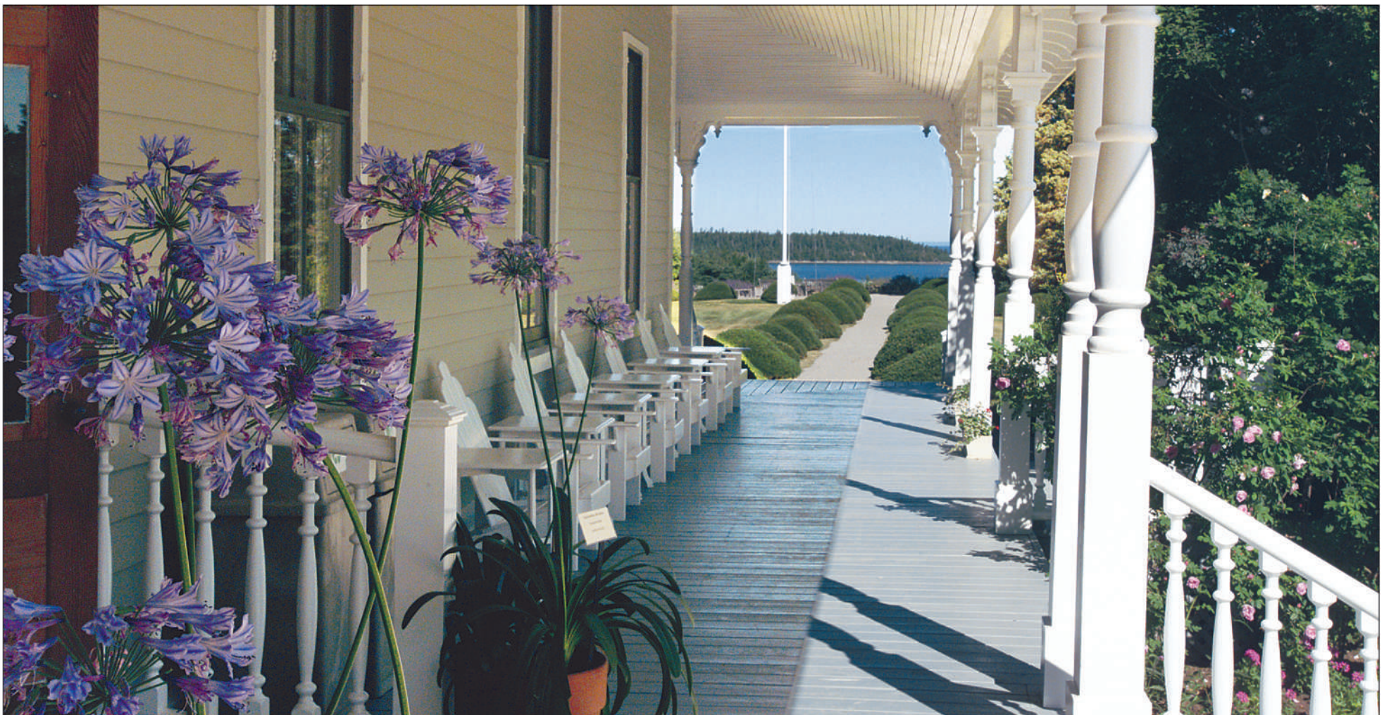
Les longues vérandas permettent aux visiteurs d'apprécier l'architecture des bâtiments et le décor de la région.

Je passe par Saint-André-de-Kamouraska et vois le dessin des Aboiteux, sorte de barrage permettant de contrôler les eaux sur les terres autrefois inondables. Tout le long, j'ai un regard affectueux pour les maisons ancestrales, les granges délaissées qui ponctuent la beauté du paysage. J'ai souvent des serrements au cœur lorsque je vois de nouvelles