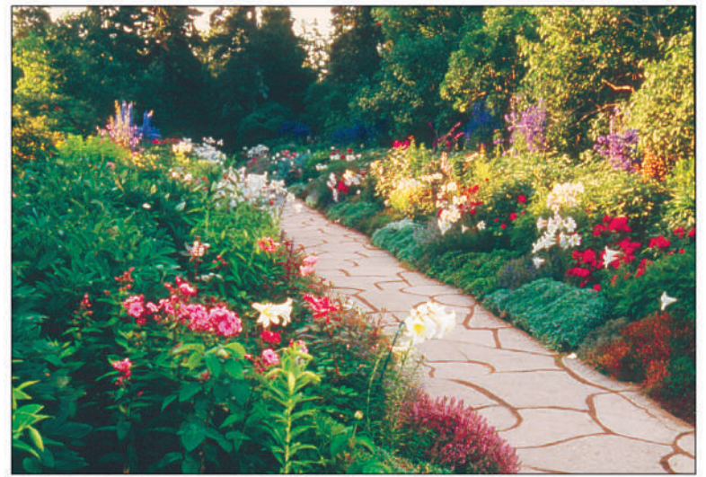
L'un des célèbres jardins