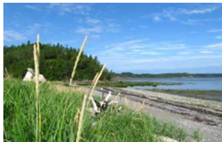
Élyme des sables

En partenariat avec le Comité ZIP du Sud-de-l'Estuaire, les Jardins de Métis s'impliquent activement dans les efforts pour lutter contre l'érosion côtière avec la production et la plantation de l'élyme des sables, une plante indigène dont le vaste système racinaire contribue à stabiliser les zones côtières. Sous la supervision de Jean-Yves Roy, nous avons produit 10 000 plants d'élyme des sables dans nos nouvelles serres. Près de 5 000 plants seront utilisés pour stabiliser la zone située à l'embouchure de la rivière Mitis et endommagée par les grandes marées du 6 décembre dernier. Les groupes environnementaux et les riverains pourront se procurer des plants au coût de 1 $ chacun pour stabiliser leur terrain. Ce projet est rendu possible grâce à l'appui financier du Fonds d'investissement communautaire de Telus, du projet Eau Bleue de la RBC et de la MRC de La Mitis. Le Comité ZIP du Sud-de-l'Estuaire collaborera avec les Jardins de Métis pour informer les citoyens sur le phénomène de l'érosion côtière lors d'ateliers et dans un kiosque d'information au cours de l'été.