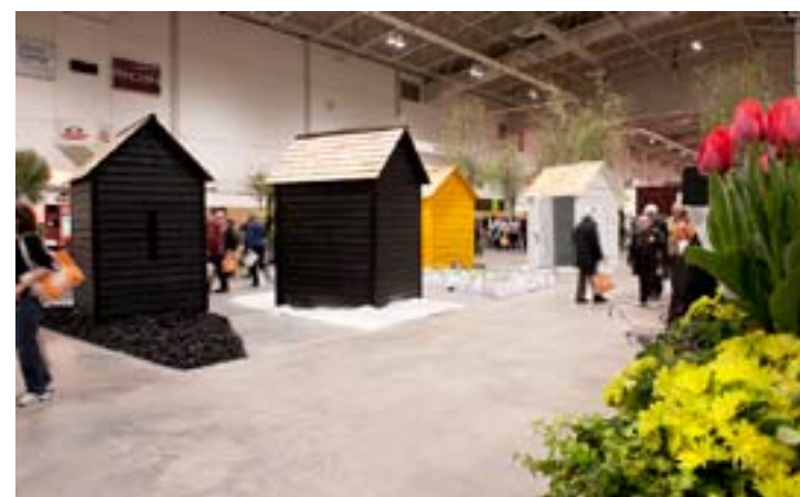
Le jardin How green is the garden? présenté à Canada Blooms en mars 2011