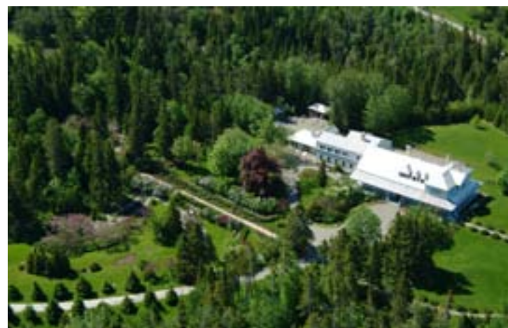
Villa Estevan, Production Phosphoric