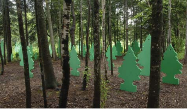
Passe-moi un sapin Rita du groupe multidisciplinaire Rita