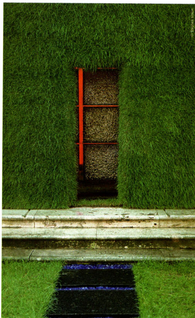
L'installation et performance « Red Box » a été créée à l'occasion de l'exposition annuelle de l'Académie américaine de Rome. Inspirée des églises romaines et de leur érotisme latent, elle mêle verre recyclé, gazon à la verticale, encens et solo de clarinette pour une redécouverte des sens.

1. Équivalent de la Villa Médicis pour les Américains. Elle accorde chaque année une bourse d'étude à une trentaine d'étudiants dans les domaines des arts et des sciences humaines.