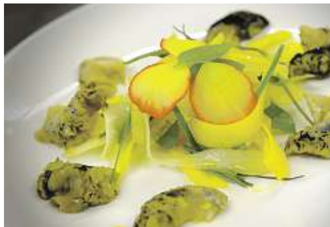
En plus des fleurs, des ingrédients locaux entrent dans la cuisine des Jardins, comme les fameux, et visqueux, bourgots.

Les jardins de Métis, route 132, à Grand-Métis. Information: 418 775-2222 ou jardinsdemetis.com