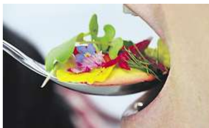
La cuillère de fleurs compte une quinzaine de variétés de fleurs ou de fines herbes