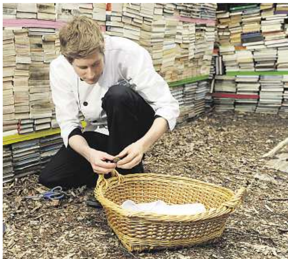
Petit miracle de la nature: au pied du Jardin de la connaissance poussent des morilles!