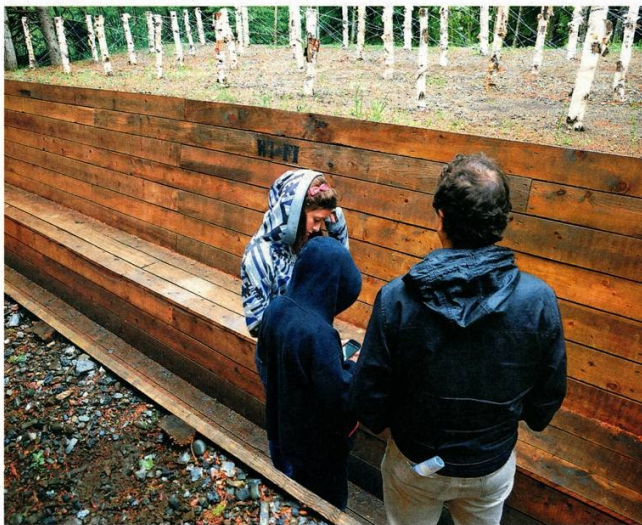
Und noch eine Gartenprovokation aus Deutschland: Martin Rein-Cano hat einen schützengrabenartigen Laufgang hinter Birkenstämmen und Drahröhren ausgehoben, in dem die Besucher die Naturschönheit aus der Soldatenspektive sehen können.

Ohne Currywurst und Seniorenandacht und nur ja nicht zu sanft sein: In den kanadischen Jardins de Métis, nahe beim Sankt-Lorenz-Strom, verschärfen deutsche Gartengestalter die Landschaftsarchitektur zur Konzeptkunst.